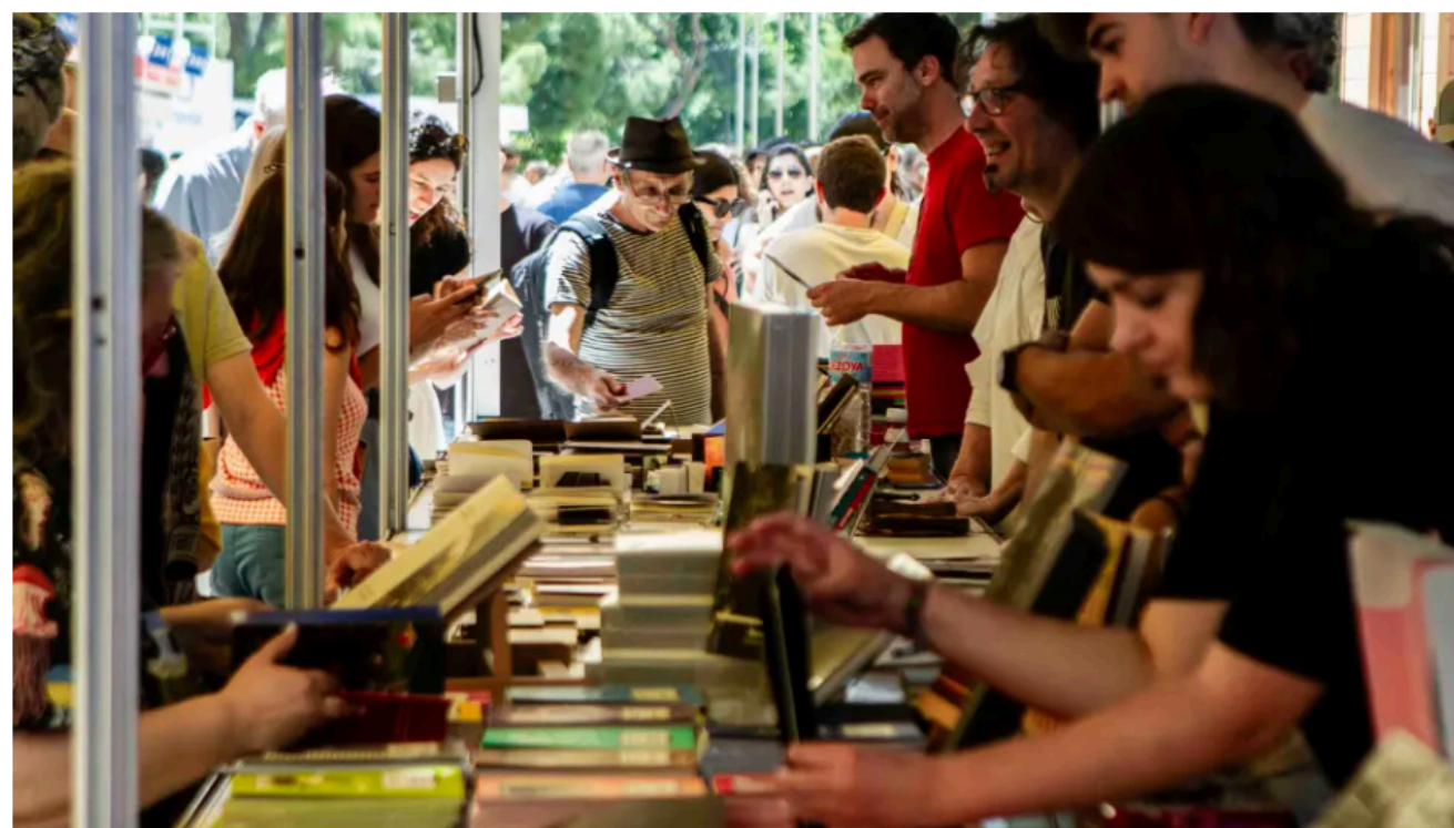
Edición anterior de Indómitas en la Feria del Libro.

El espacio Indómitas consolida en 2025 su presencia en la Feria del Libro de Madrid como plataforma de innovación editorial, experimentación creativa y nuevas formas de entender el libro . Es una iniciativa organizada por el festival POETAS que vuelve al final del paseo de Carruajes de El Retiro con una particular y única representación de librerías y editoriales nacionales e internacionales que, con el carácter rompedor de sus publicaciones y su canal de distribución alternativo.