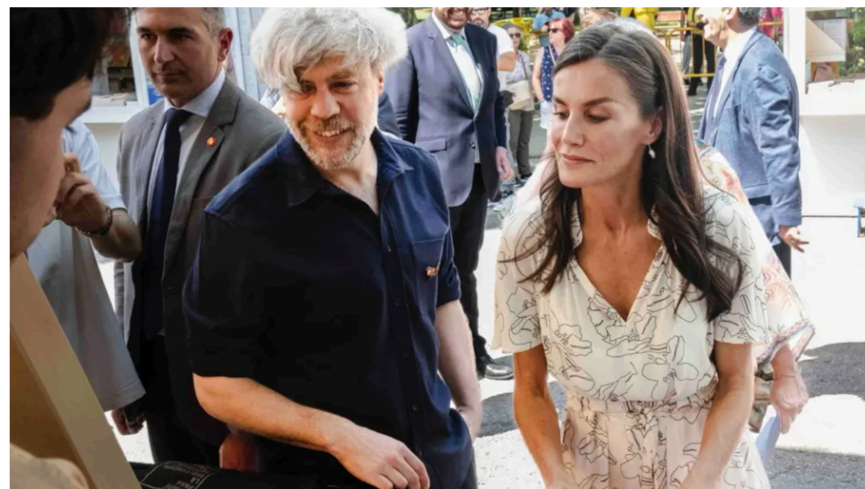
La reina ha visitado este año por segunda vez el stand. Junto a Pep Olona el día de la inauguración.

En un lugar de la Feria, de cuyo nombre sí quiero acordarme, hay una caseta grande y abierta por las cuatro esquinas, situada en el centro del paseo. Allí conviven algunas de las llamadas editoriales independientes, las que se salen del circuito convencional y comercial por el tipo de trabajo que realizan y por el volumen de sus catálogos, entre 25 y 79 títulos al año.