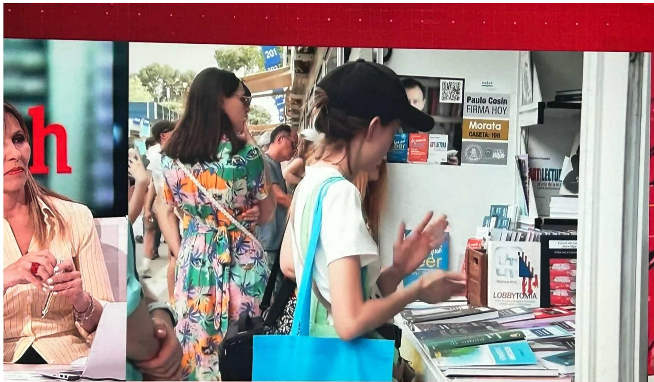
'Editoriales Indómitas' en la Feria del Libro El punto de encuentro para editoriales alternati

DS Y UNA VEINTENA DE HERIDOS TRAS UN ATAQUE AÉREO "MASIVO" DE RI