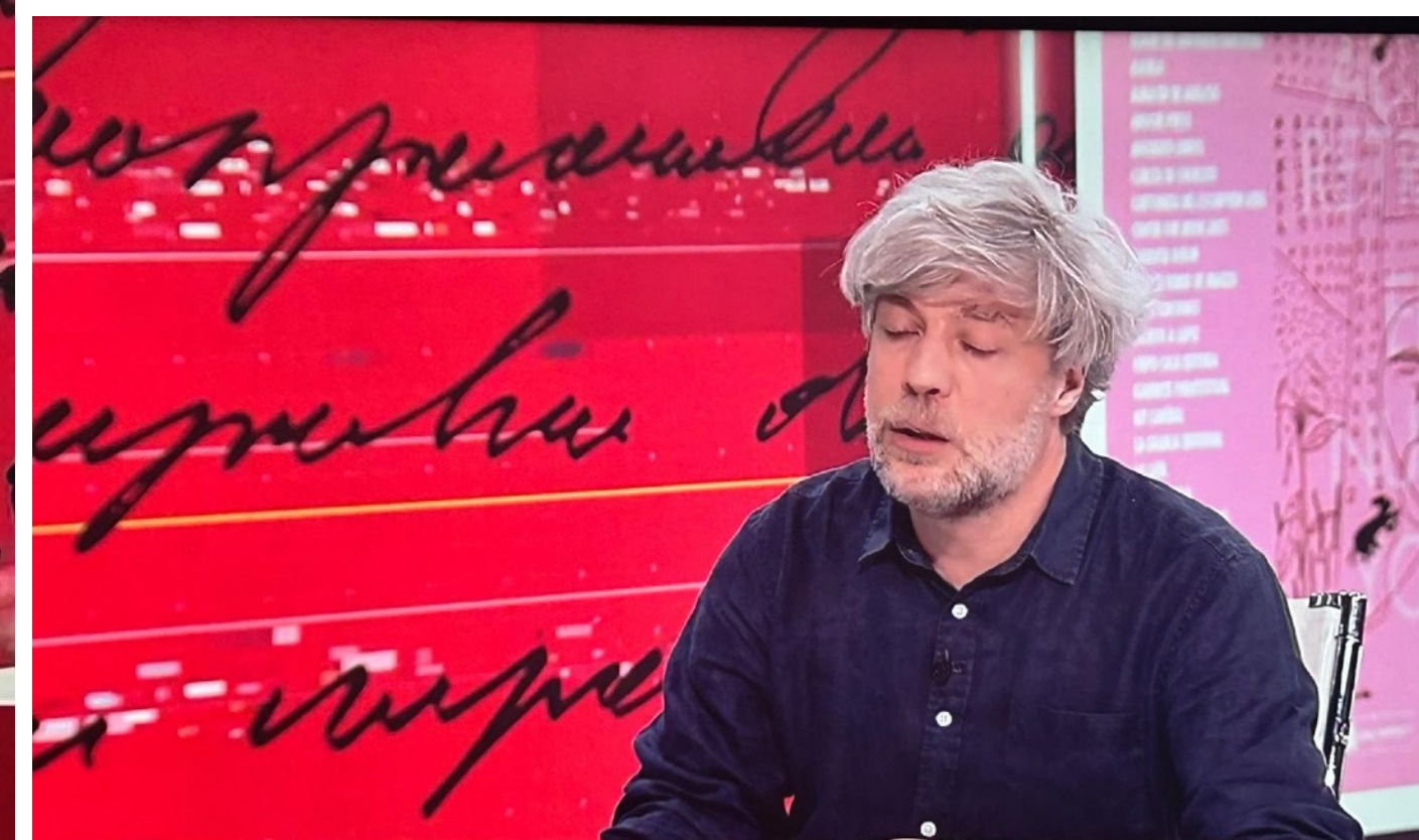
'Editoriales Indómitas' en la Feria del Libro Libros-objeto, fanzines, libros de artista...

DS Y UNA VEINTENA DE HERIDOS TRAS UN ATAQUE AÉREO "MASIVO" DE RI