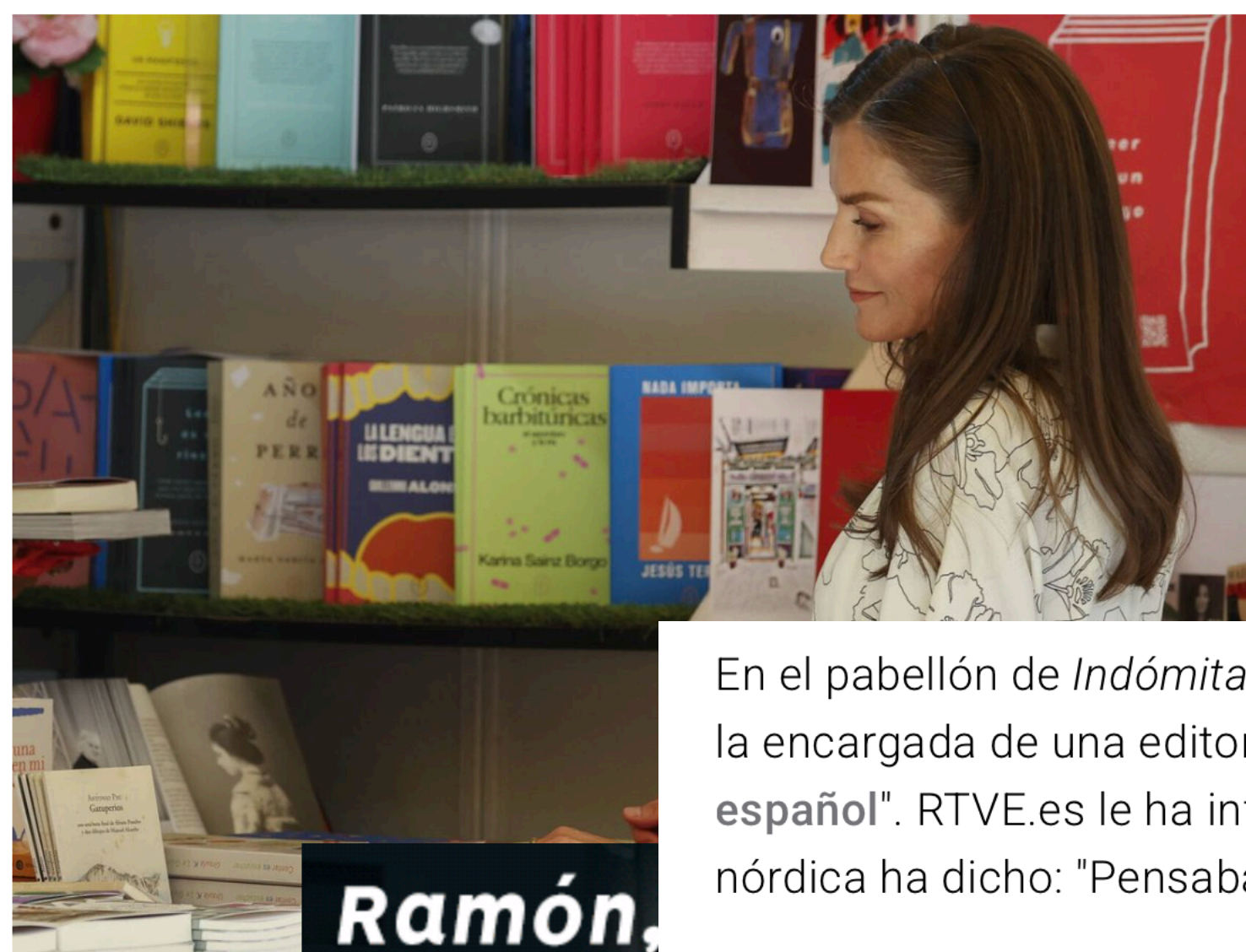
Doña Letizia, durante su visita a la Feria del

La reina se ha paseado por El Retiro, donde ha confesado algunos secretos y ha podido hablar de cerca con librerías y editores sobre una de sus pasiones: la lectura