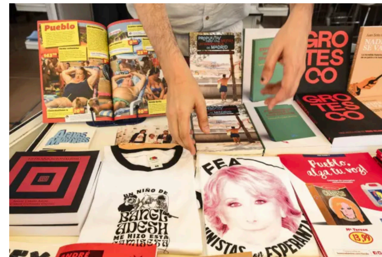
Textos que se venden en la caseta de Indómitas.