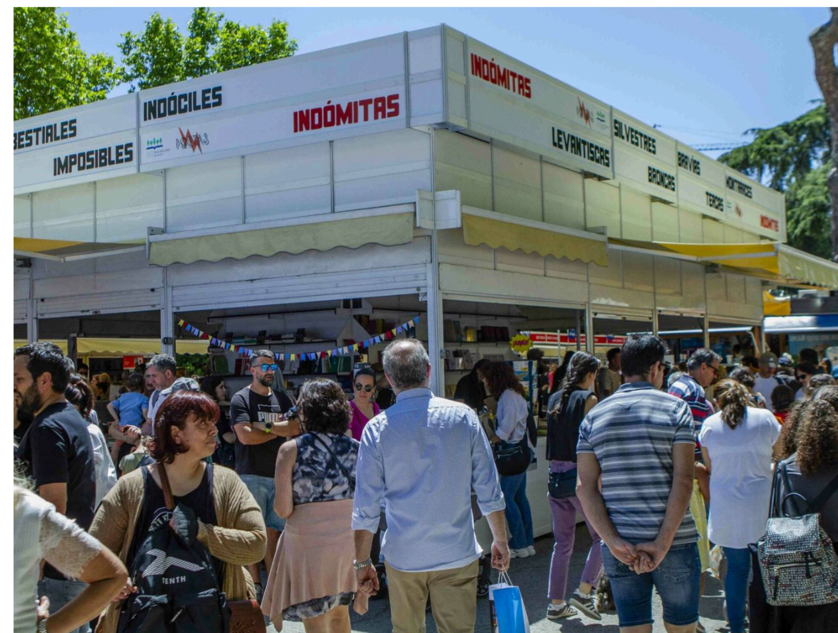
Stand de Indómitas

De todas formas, que este tipo de editoriales tengan un pequeño espacio en convocatorias tan grandes e institucionalizadas no es algo ni fortuito ni improvisado , sino el resultado de un esmerado proceso de curación que se alarga prácticamente un año. "Me sorprendió que esta forma de entender el libro y la creación también estaba muy presente en la Feria del Libro de Guadalajara, en México, y en la de Bogotá , en Colombia", comenta Olona . En esta ocasión, hasta 21 editoriales se estrenan en el Espacio Indómitas de la FLM.