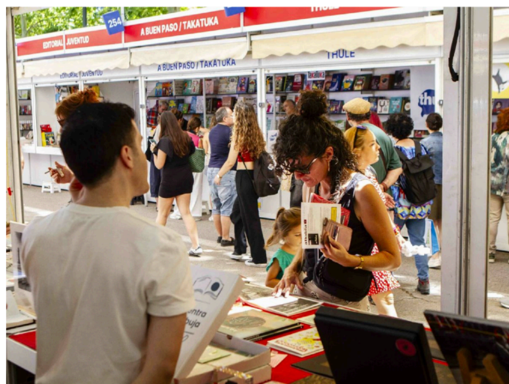
Indómitas busca en la Feria del Libro otras formas de lectura y de creación (Imagen cedida: Indómitas)

Hasta 21 editoriales se estrenan en el Espacio Indómitas de la Feria del Libro durante los dos primeros fines de semana de la cita cultural. El objetivo de la iniciativa es compartir otras formas de crear y de leer